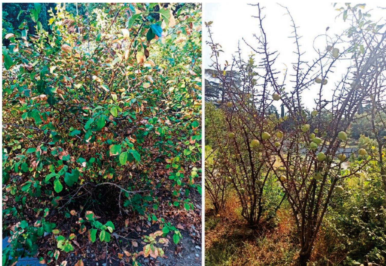
Рис. 1. Внешний вид кустов хеномелеса в конце летнего засушливого периода 2023 г.: Chaenomeles speciosa в озеленении г. Ялта (слева), Ch. cathayensis в Никитском ботаническом саду

В исследование были включены 16 новых гибридов хеномелеса с морфотипами Ch. speciosa , Ch. × superba и Ch. cathayensis из коллекции Никитского ботанического сада – Национального научного центра РАН. Контролем