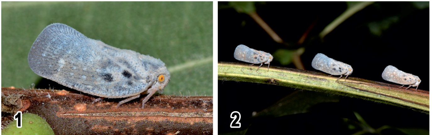
Рис. 2. Metcalfa pruinosa : 1 – имаго; 2 – группа цикадок Fig. 2. Metcalfa pruinosa : 1 – imago; 2 – leafhoppers group