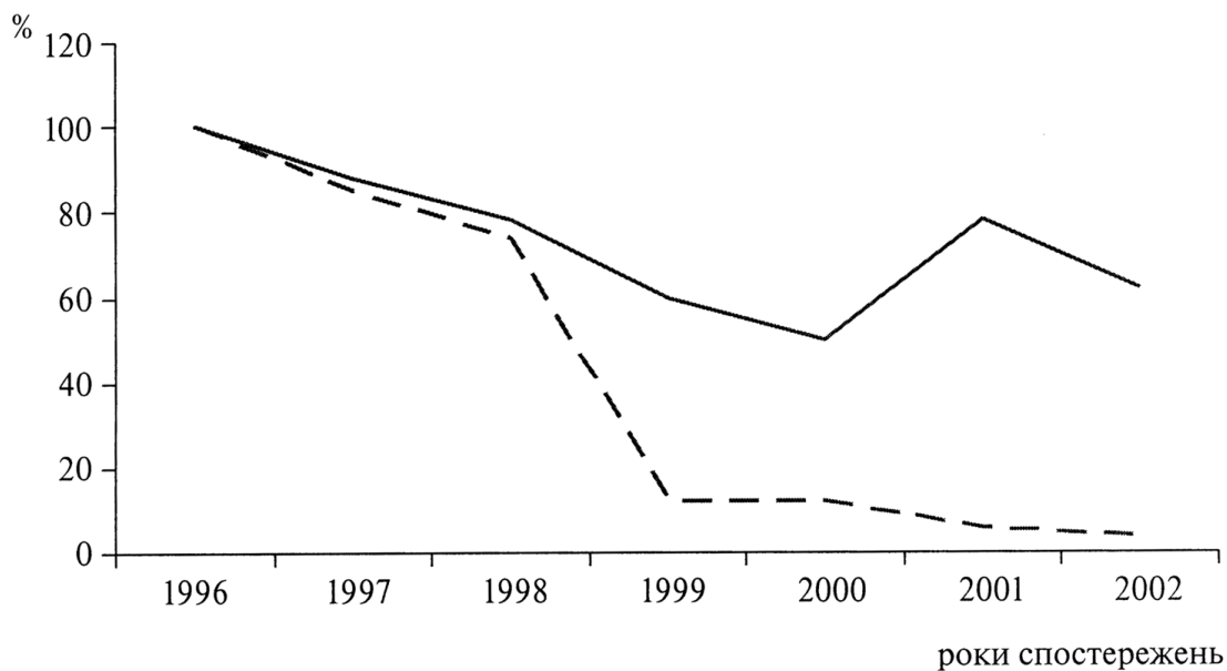
Рис. 2 Динаміка кількості особин в злаково-бобовому угрупованні: