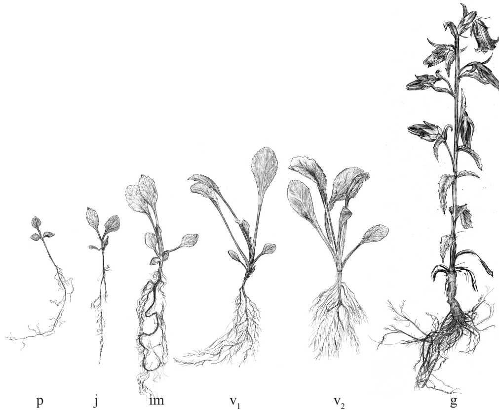
Рис. 1. Схема онтогенетического развития Campanula medium L. при интродукции в условиях степной зоны Украины:

Проростки. Семена прорастают на 23-й день. Прорастание их надземное. Эпикотиль укорочен, проросток имеет форму розетки. Первый лист разворачивается над семядолями на 12-й день после прорастания. Высота растений 2,5–3,1 см. Длина семядолей 5,0–6,0 мм, ширина 3,5–5,0 мм. Длина первого настоящего листа 5,0–8,5 мм, ширина 4,0–7,0 мм. Длина главного корня 6,1–11,8 см, ветвится до второго порядка (рис. 1). Продолжительность состояния проростков 38–40 дней.