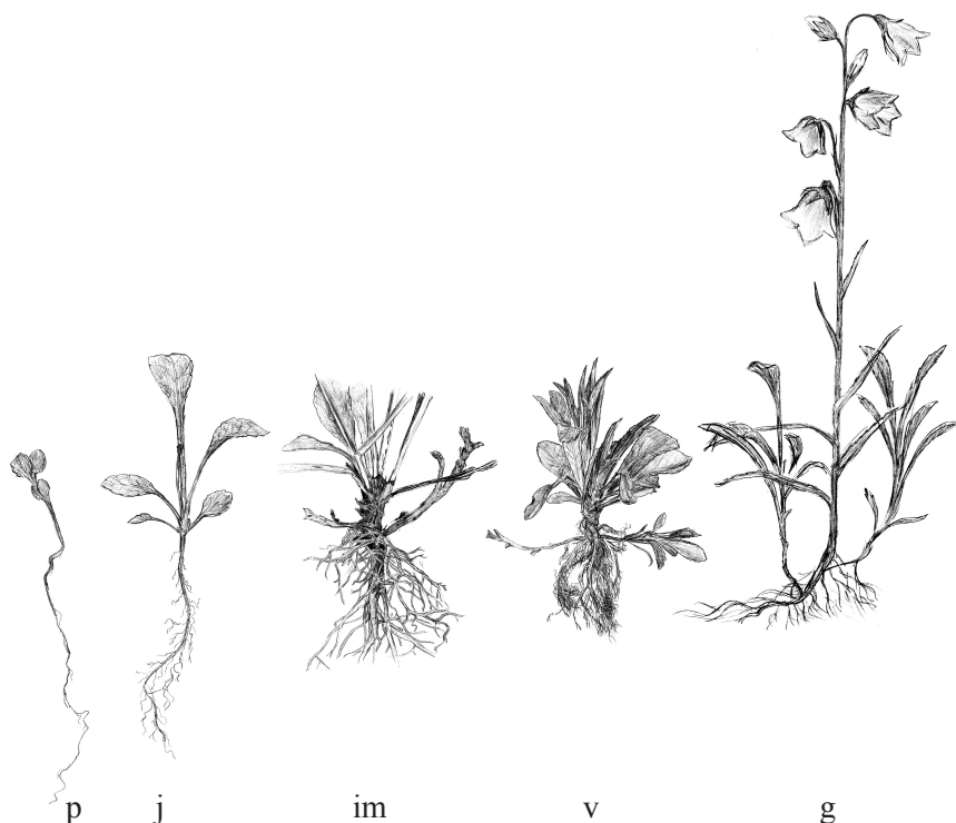
Рис. 4. Схема онтогенетического развития Campanula persicifolia L. при интродукции в условиях степной зоны Украины:

Имматурное возрастное состояние характеризуется отмиранием семядолей и первого листа, появлением 5–8 листьев, 2–3 из которых ювенильного типа. Остальные листовые пластинки «переходного типа» – яйцевидные или ланцетные, размером 0,2–0,4 см × 1,3–1,8 см, черешок 2,0–4,0 см, верхушка листьев тупая, основание округлое, край городчатый. Главный корень ветвится до второго порядка, длина его 5,2–8,5 см. Насчитывается 10–15 боковых корней. На гипокотиле формируются придаточные корни. Имматурные особи представляют одноосные розеточные растения. Продолжительность имматурного состояния 90–95 дней.