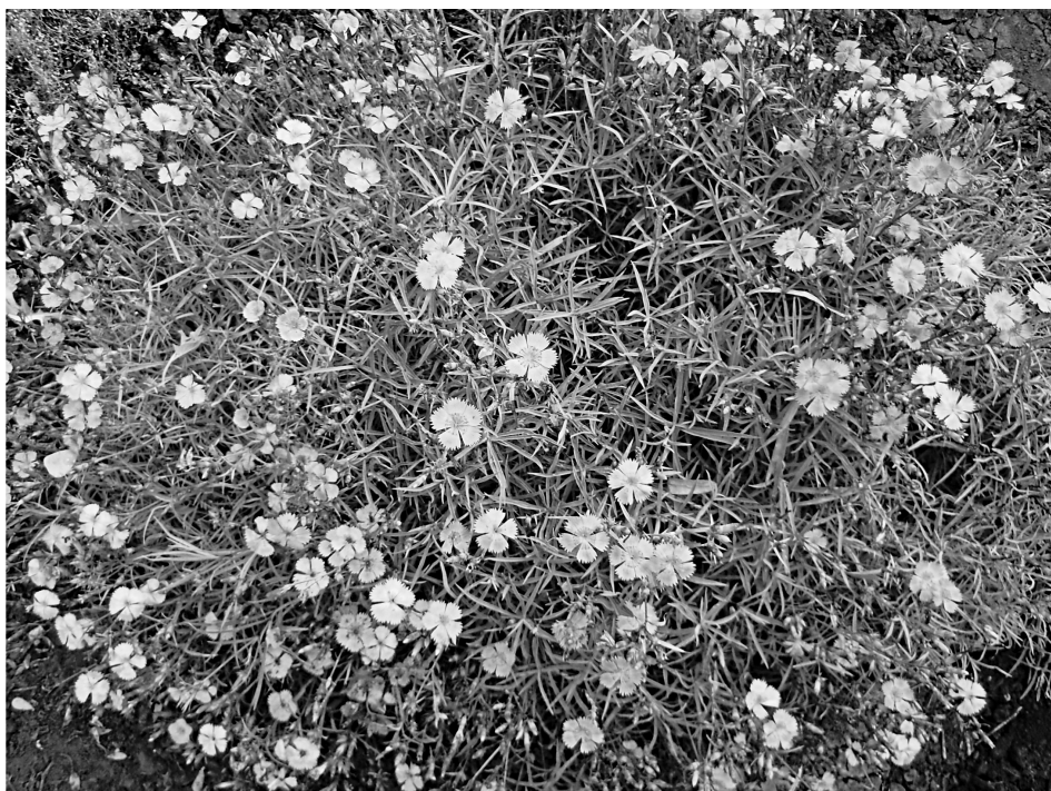
Рис. 2. Зрелое генеративное растение Dianthus seguieri Vill.

признаков относятся: обильность и продолжительность цветения, декоративные качества цветков, габитус, способность к семенному и вегетативному размножению, устойчивость к вредителям и болезням. При оценке каждого признака использовалась пятибалльная шкала и коэффициент значимости признака. Оценка перспективности, проведенная путем суммирования баллов по всем признакам, составила 90 баллов. Это означает, что D. seguieri относится к числу очень перспективных видов для введения в культуру на юго-востоке Украины.