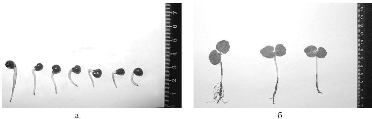
Рис. 1. Hibiscus esculentus L. : а – проростання насіння ; б – проростки