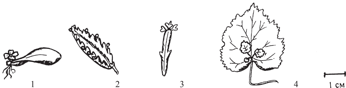
Рис. 1. Естественное вегетативное размножение листьями:

Выводковые почки могут образовываться также у основания листовой пластинки на материнском растении, например, у Tolmiea menziesii (Pursh) Torr. et Gray (Saxifragaceae Juss.), естественно произрастающей в сырых прибрежных летнезеленых лесах, по берегам горных ручьев на Тихоокеанском побережье Северной Америки [12]. По нашим наблюдениям, у растений выводковые почки образуются у основания сформированных листьев почти на протяжении всего